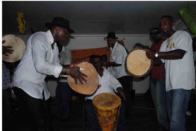
Les tambouyens du groupe immortels