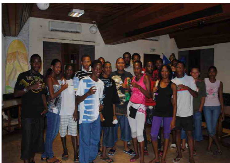
Des jeunes de Sinnamary lors de la rencontre avec le service cohésion sociale et vie associative