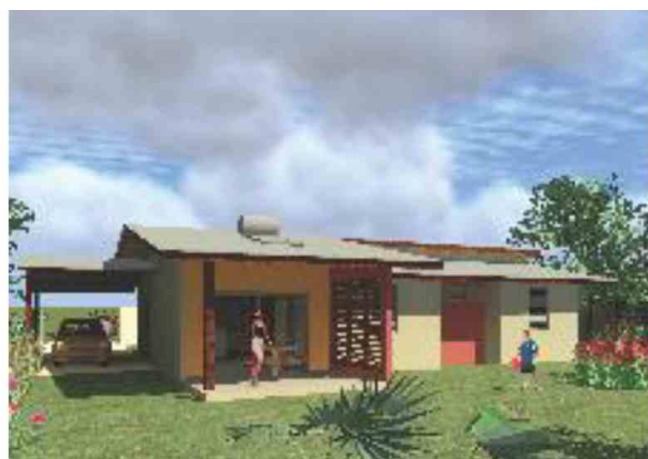
Projet de villa T5

L'équipe Municipale a la volonté de développer l'accession à la propriété des habitants. C'est ainsi que la SARL « Amazone programmes » projette de réaliser, avec le soutien de la collectivité communale, un ensemble résidentiel de 70 logements mixtes.