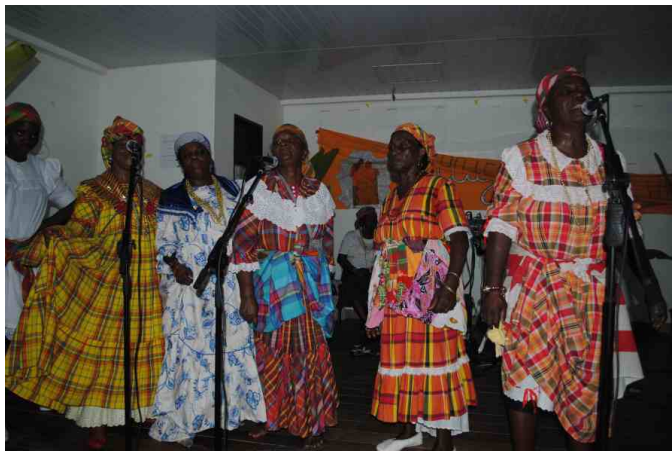
Les immortels-les coeurs