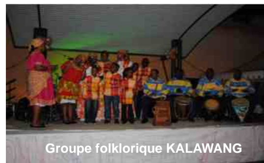
Groupe folklorique KALAWANG