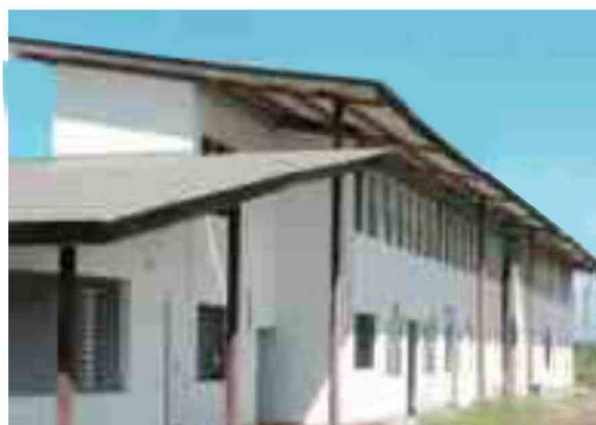
L'hôtel d'entreprises en voie d'achèvement

Les locaux seront équipés et meublés à usage occasionnel et les locations proposées à la journée, à la semaine ou au mois. Alors n'hésitez plus ! Contactez nos services dès aujourd'hui.